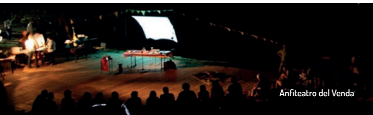
Anfiteatro del Venda