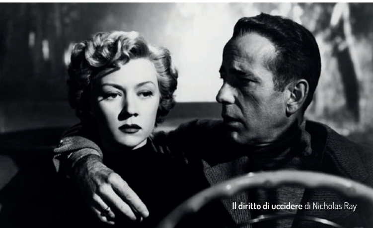
Il diritto di uccidere di Nicholas Ray

In caso di pioggia la proiezione verrà annullata