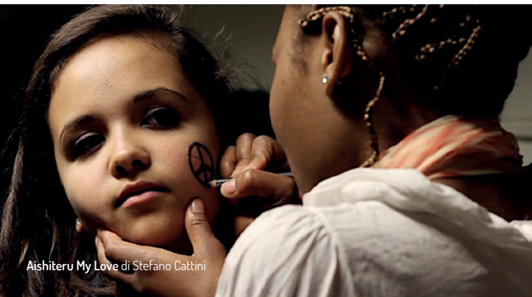
Aishiteru My Love di Stefano Cattini

Il Castello del Catajo: via Catajo 1 a Battaglia Terme (PD). www.castellodelcatajo.it Azienda Agricola Salvan: via Mincana 143, Due Carrare (di fronte al Castello del Catajo). www.salvan.it