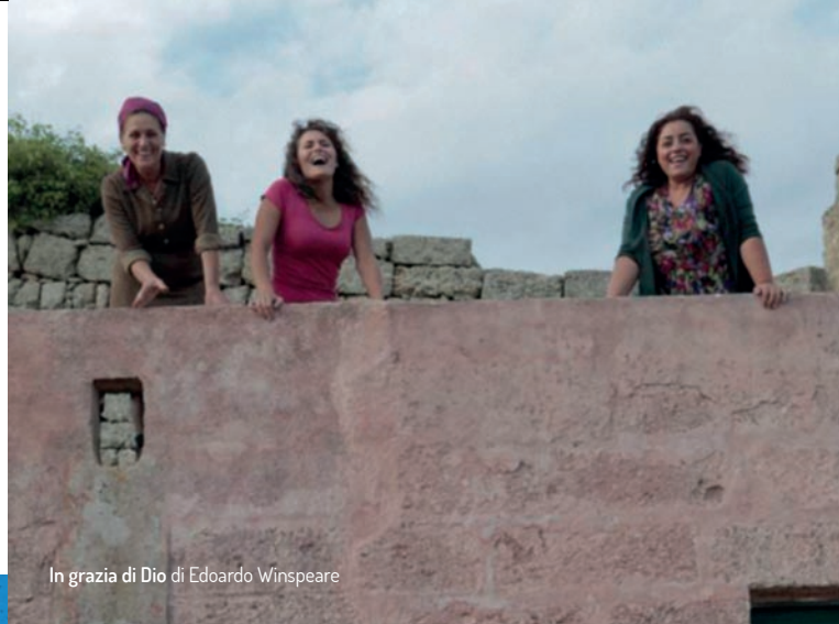
In grazia di Dio di Edoardo Winspeare

In caso di pioggia la proiezione sarà spostata al Centro Civico Fabio Presca, via Colombo, 1 a San Domenico di Selvazzano.